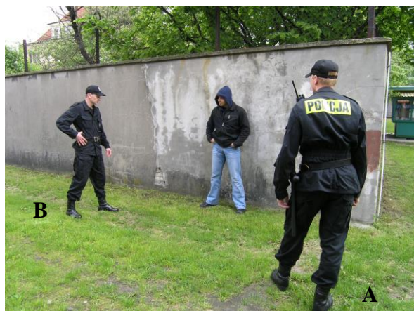
Fot. 1. i 2. Przykładowe ustawienie w sytuacji legitymowania zgodnie z zasadą trójkąta bezpieczeństwa: A – policjant legitymujący, B – policjant asekurujący

Legitymowanie powinno być poprzedzone podziałem ról oraz doбором miejsca legitymowania. Policjant legitymujący ustawia się względem osoby legitymowanej dalej niż policjant asekurujący, którego zadaniem jest energiczna reakcja na zachowanie osoby legitymowanej, gdyż policjant notujący dane personalne czy też prowadzący korespondencję jest pozbawiony możliwości natychmiastowego działania.