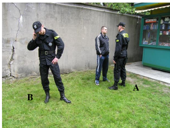
Fot. 3. Przykład sytuacji niedopuszczalnej: A – policjant legitymujący, B – policjant asekurujący

Legitymowanie powinno być poprzedzone podziałem ról oraz doбором miejsca legitymowania. Policjant legitymujący ustawia się względem osoby legitymowanej dalej niż policjant asekurujący, którego zadaniem jest energiczna reakcja na zachowanie osoby legitymowanej, gdyż policjant notujący dane personalne czy też prowadzący korespondencję jest pozbawiony możliwości natychmiastowego działania.