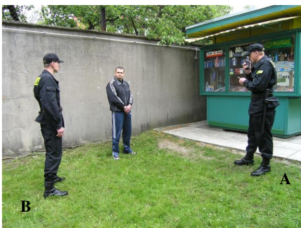
Fot. 5. Nawiązywanie łączności z dyżurnym jednostki: A – policjant legitymujący, B – policjant asekurujący

Jednym z newralgicznych momentów w czasie legitymowania jest moment przekazania dokumentu, na podstawie którego ustala się tożsamość. W celu zapewnienia sobie bezpieczeństwa należy pamiętać o zachowaniu bezpiecznej odległości, czyli o tzw. zasadzie dwóch wyciągniętych ramion, i jednocześnie o zachowaniu stabilnej postawy.