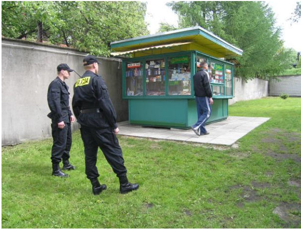
Fot. 6. Obserwacja osoby legitymowanej po zakończeniu interwencji

Po zakończeniu legitymowania istotne jest obserwowanie osoby oddalającej się z miejsca legitymowania. Dlatego policjanci nie powinni tracić z oczu osoby legitymowanej od razu po oddaniu dokumentu.