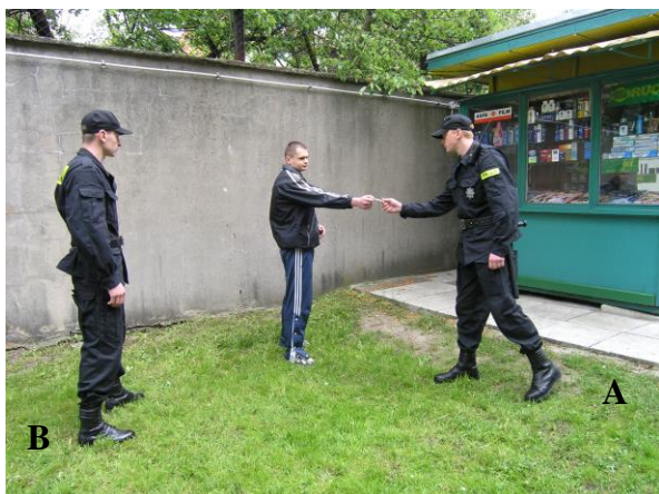
Fot. 4. Przekazanie policjantowi dokumentu tożsamości: A – policjant legitymujący, B – policjant asekurujący

Jednym z newralgicznych momentów w czasie legitymowania jest moment przekazania dokumentu, na podstawie którego ustala się tożsamość. W celu zapewnienia sobie bezpieczeństwa należy pamiętać o zachowaniu bezpiecznej odległości, czyli o tzw. zasadzie dwóch wyciągniętych ramion, i jednocześnie o zachowaniu stabilnej postawy.